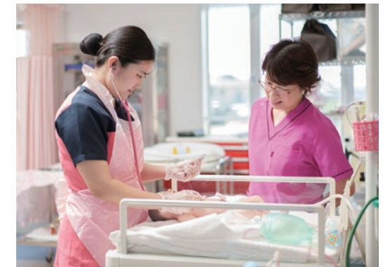
出生直後の新生児ケア