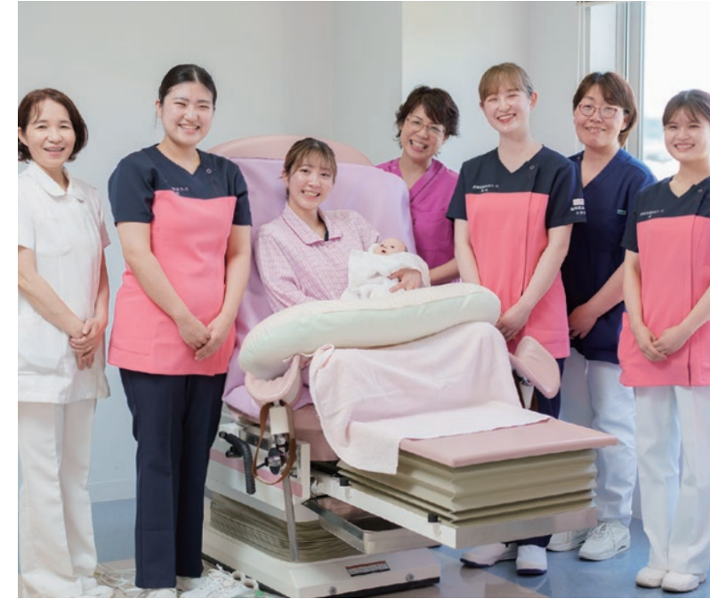
教員と演習(シミュレーション)