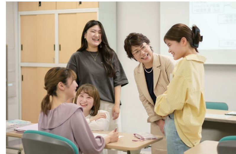
講義内でのディスカッション