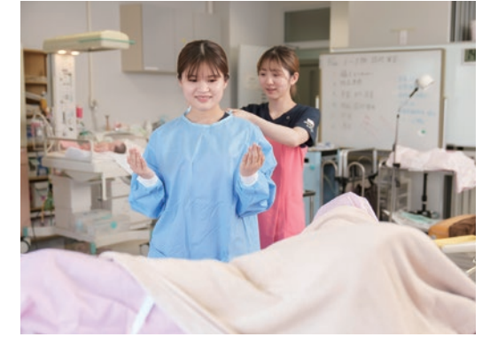
分娩介助技術演習