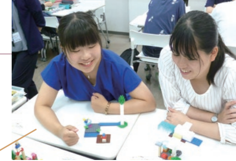
ブロックを使った研修

「自己理解力」「統合的学修力」「創造的な思考力」 「キャリアデザイン力」「計画的学修推進力」「職業観・勤労観力」